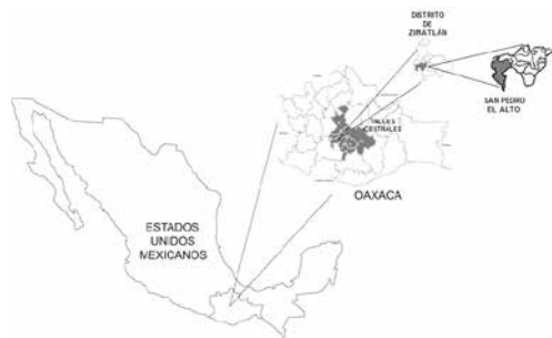
Figura 1. Mapa de localización de San Pedro el Alto, Zimatlán